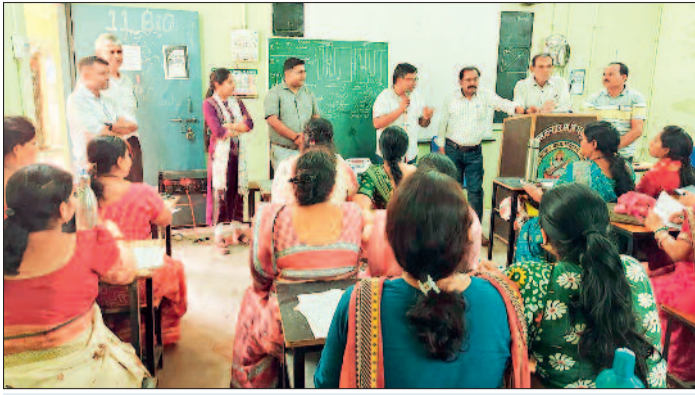
गुरुर। नगर पालिका आम निर्वाचन के तहत नगर पंचायत पलारी में निर्वाचन कार्य हेतु शासकीय कक्षा उच्च माध्यमिक शाला पलारी में 22 मई को प्रथम चरण के प्रशिक्षण दिया गया। प्रशिक्षण के दौरान पीठासीन अधिकारी, मतदान अधिकारी